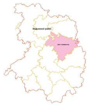
Схема расположения СП "Село Адуево" Медынского района

Приложение № 2 к Правилам землепользования и застройки муниципального образования СП "Село Адуево" утвержденным Решением Сельской Думы СП "Село Адуево" № от 2018г.