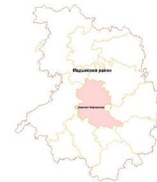
Схема расположения СП "Деревня Варваровка" Медынского района