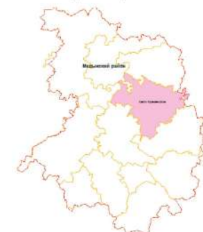
Схема расположения СП "Село Кременское" Медынского района

Приложение № 1 к Правилам землепользования и застройки муниципального образования СП "Село Кременское" утвержденным Решением Сельской Думы СП "Село Кременское" № от 2017г.