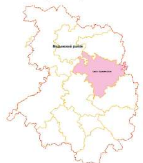
Схема расположения СП "Село Кременское" Медынского района

Приложение № 1 к Правилам землепользования и застройки муниципального образования СП "Село Кременское" утвержденным Решением Сельской Думы СП "Село Кременское" № от 2017г.